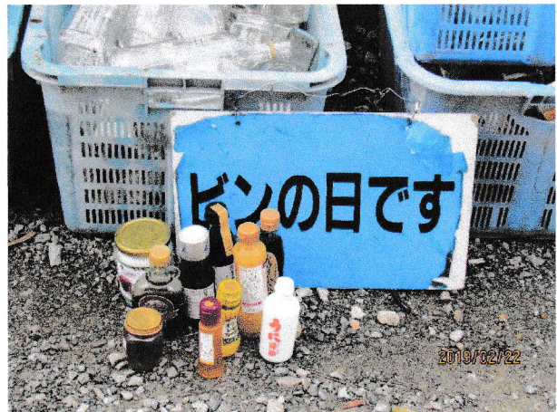
中身が入っている(未使用品もある)