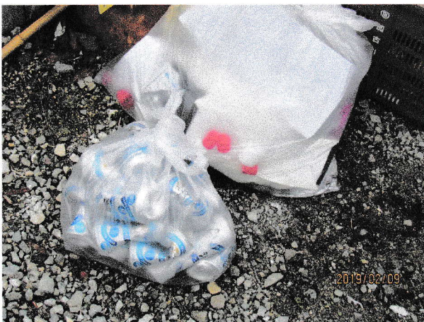
時間遅れの収集漏れ