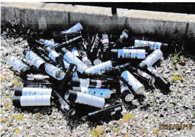
*全ての蓋とノズルは分離を……。