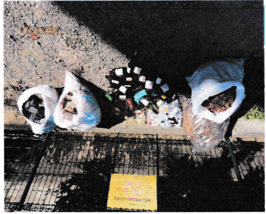
* 誰が片付けるのですか?