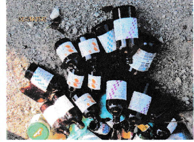
* 化粧品と医薬品のペンは収集されません