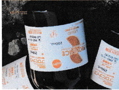
* 化粧品と医薬品のペンは収集されません